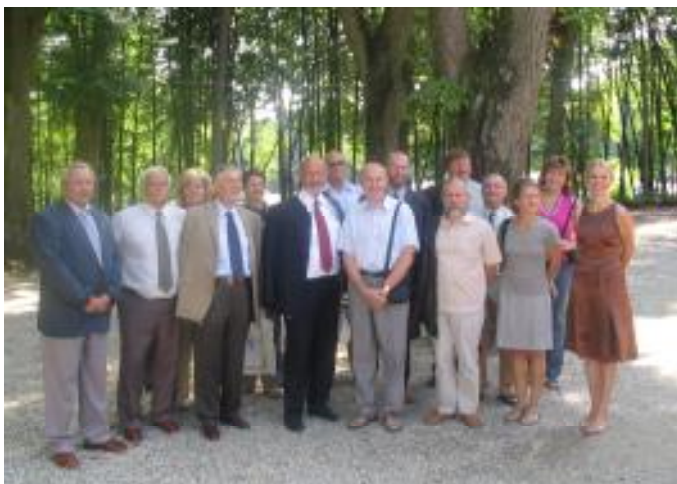
Představitelé česko-rakouského příhraničí na Zemské výstavě v Heldenbergu