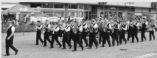
Městský dechový orchestr při ZUŠ Dačice - po celý den