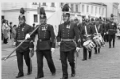
10.00 hod. Ostrostřelci z Waidhofenu/Thaya