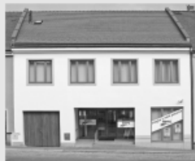
pobočka WSPK v Dačicích

Waldviertler Sparkasse von 1842 Vás zve na VELKOU SLAVNOST na pobočce v Dačicích.