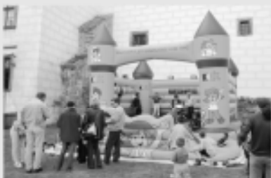
Skákací hrad po celý den