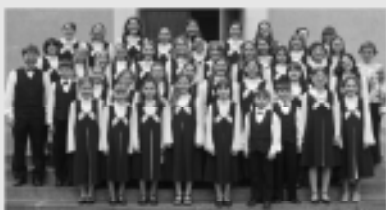
14.00 - 14.30 hod. Pěvecký sbor Kvítek