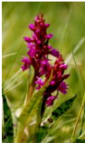
Prstnatec mákový (Dactylorhiza majalis)

Po delší odmlce opět zdravím všechny přítele přírody na Dačicku i všude jinde. Hned se na Vás obracím s prosbou. Naše nadace ČSOP bude v letošním roce zajišťovat mapování našich orchidejí. Svůj projekt jsme nazvali „Orchideje Vysočiny a České Kanady“. V našem kraji se můžeme setkat s těmito kráskami: hlístník hnízdaček, vemeník dvoulistý, vemeník