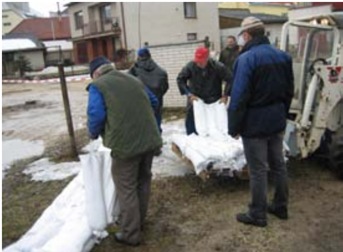
29. 3. 2006, Dačice