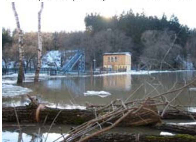
29. 3. 2006, Dačice