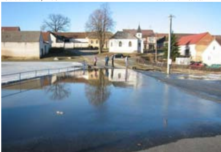
29. 3. 2006, Zámeček, St. Hobzí