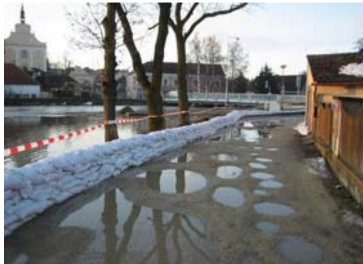
30. 3. 2006, Dačice