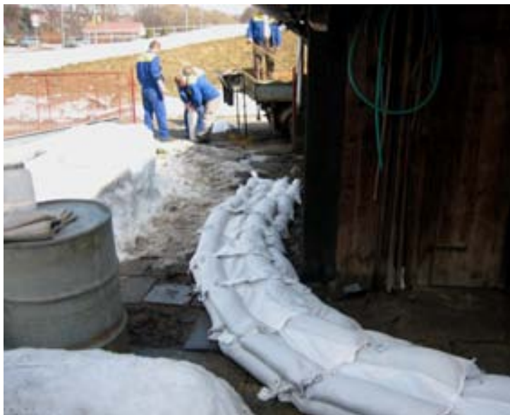
28. 3. 2006, Bílkov