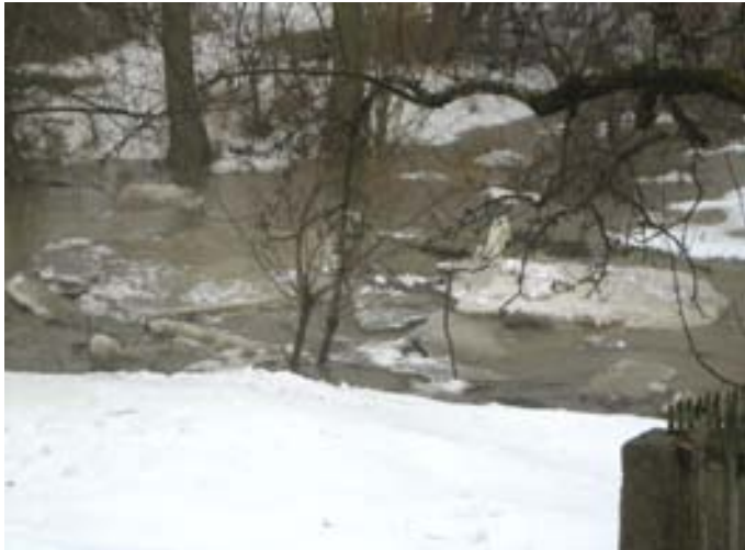
28. 3. 2006, Dačice