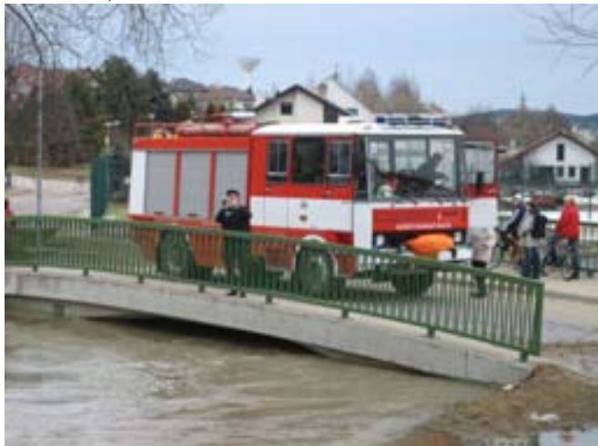
30. 3. 2006, Dačice