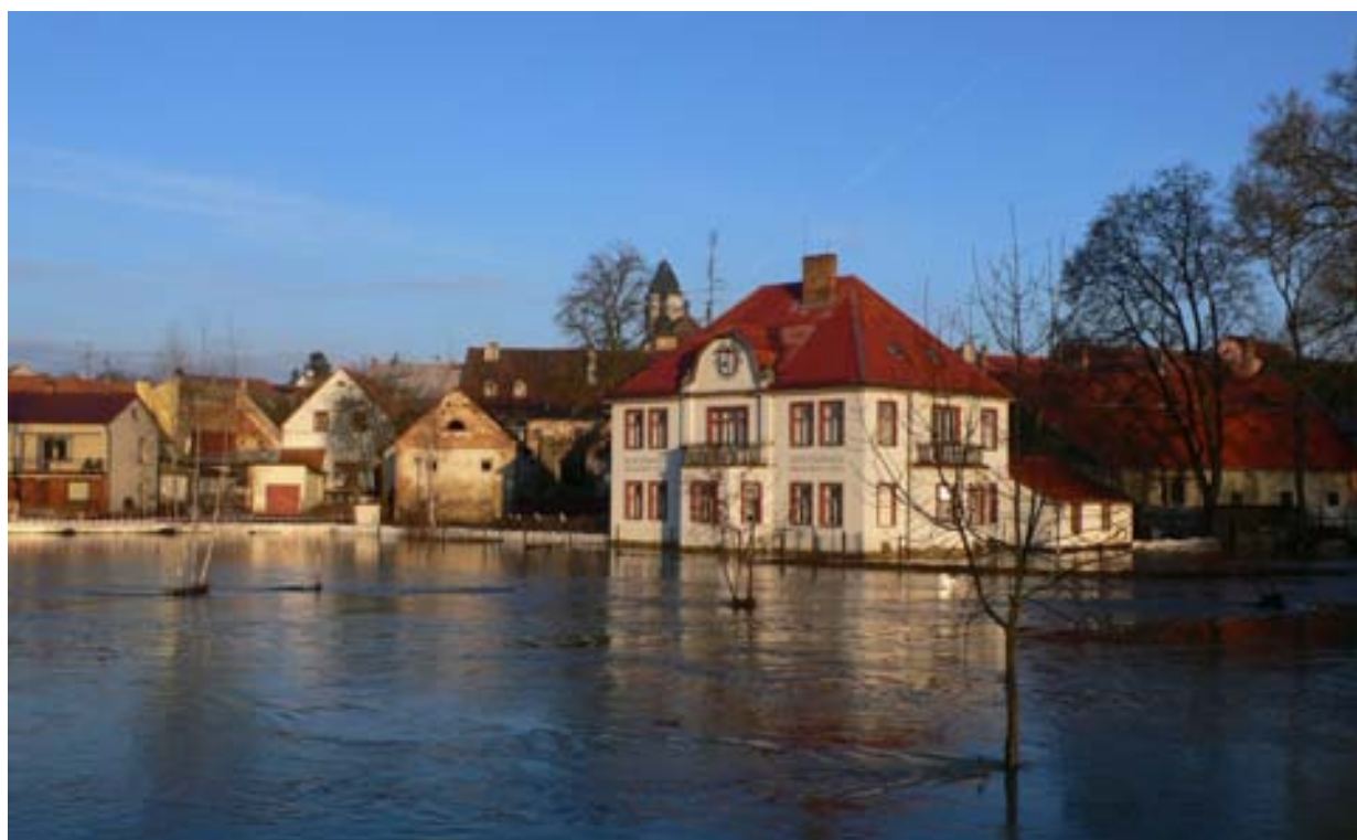
30. 3. 2006, Dačice