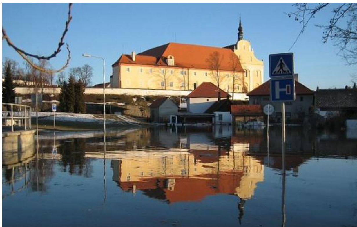
29. 3. 2006, Dačice