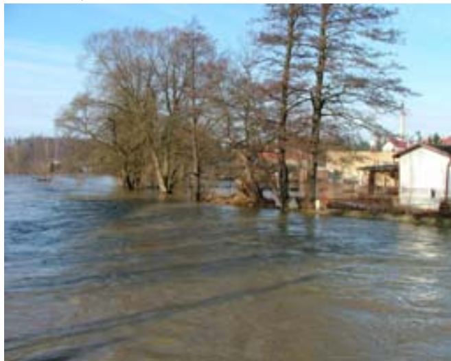
30. 3. 2006, Dačice