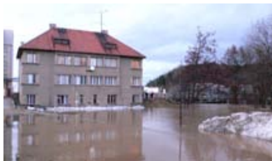
31. 3. 2006 zaplavila voda prostor za domy v Nádražní ulici.

Ano, pro pojišťovnu už to tady nafotil pan domáci. Před malou chvílí u nás byli strážníci Městské policie a přinesli nám papíry na slevu elektřiny kvůli vysoušení bytu. Prostě dobrý. Na to, že to bylo všechno takhle, je to dobrý. A až to budete psát, nezapomeňte poděkovat hlavně hasičům, kteří nám opravdu moc pomohli