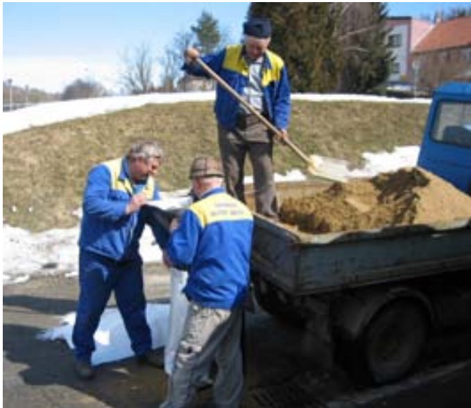
27. 3. 2006, Dačice