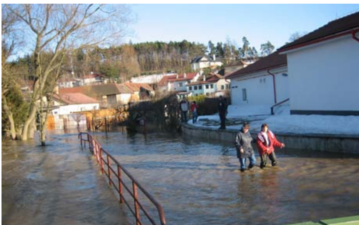
29. 3. 2006, Dačice