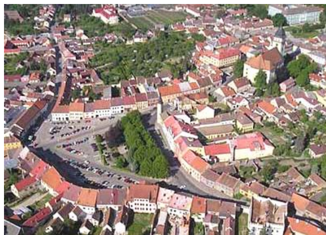
Foto měsíce z webových stránek města: Dačice z motorového paraglidu.