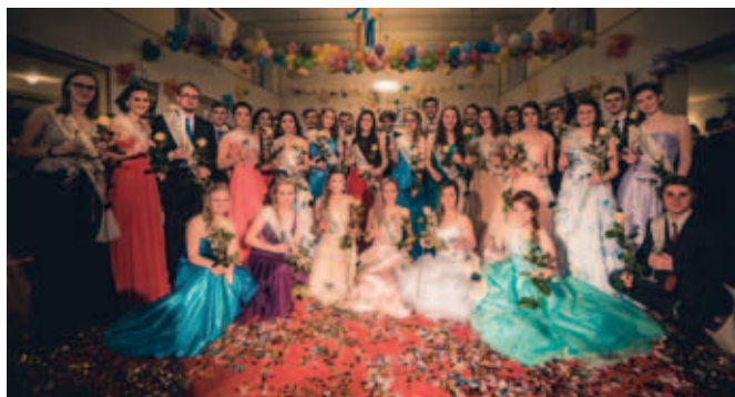
Maturitní ples 4. ročníku, 19. 1. 2018, KD Hřišice

Informace o dalších akcích školy najdete na www.gymn-dacice.cz a www.g-one.tv