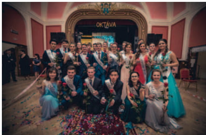
Maturitní ples oktávy, 26. 1. 2018, KD Beseda Dačice